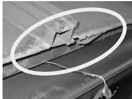
トタンが腐って穴が...