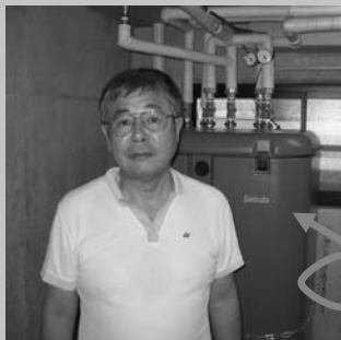
おひさまの蓄熱タンク