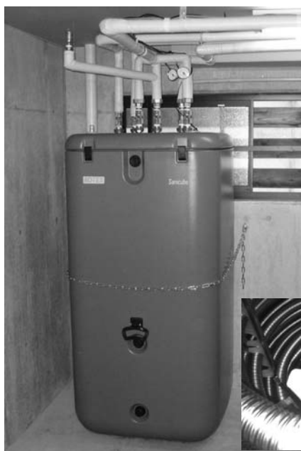
↑ ドイツ製 500ℓの熱交換蓄熱タンク