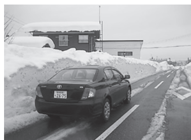
道路のあちこちに2m近い壁が…

などアツという間の豪雪モード突入です。中にはその初雪で雪下しされた方も大勢いらっしやいましたし、近年の異常気象を象徴するような猛烈な降り方でしたね。以前にも小欄で紹介したことがありますが、