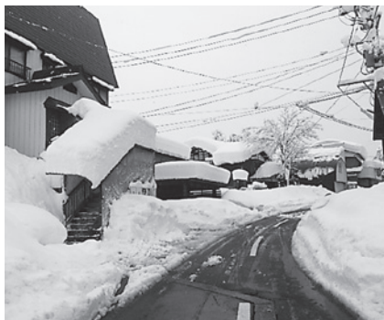
12月15日 十日町市内 地震のことを考えると屋根の雪はあまり積もらせておきたくないですね…。

「大雪お見舞い申し上げます」 十二月初旬から大雪に見舞われ、皆さまには心よりお見舞い申し上げます。緊急修理に夜間にも回らせて頂いております。 少しでも早く安心して頂けるよう社員全力で対応させて頂いておりますので、宜しくお願いします。 「この安心感は灯油代に 変えられないよ(笑)」 先日ある高齢女性一人暮らしのお客様にお会いしました。 融雪の状況を聞くと、自動から手動運転に切り替え、ポイラー温度を上げてこの大雪を対処していました。 「融雪があつて助かるよ、この安心感は灯油代には代えられないね(笑)」と笑顔で話してくれました。 まだ冬は続きます、皆で元気に乗り越えましょう。