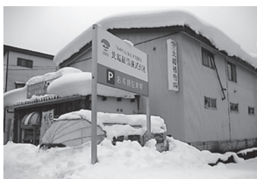
エアストリームも埋まっています

今年もまた雪のシーズンがやって参りました。今冬は初雪がいきなり80cmのドカ雪で、矢継ぎ早にきた第二波では一気に積雪1.5mを超える