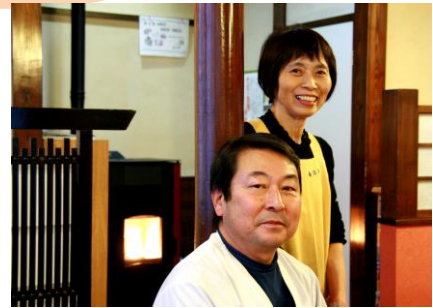
十日町市土市「生そば 春日屋」さま

店の場合は設置条件があり、施工からアフターまで安心して任せられる業者選びが大切だと実感しています。